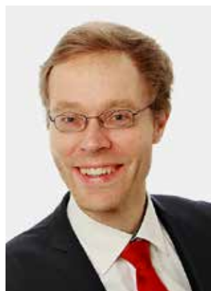
Jörg Agthe Erster Bürgermeister