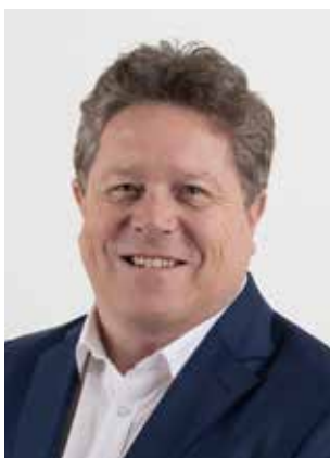
Wolfgang Strohmaier Erster Bürgermeister

Wir wünschen Ihnen viel Freude beim Lesen.