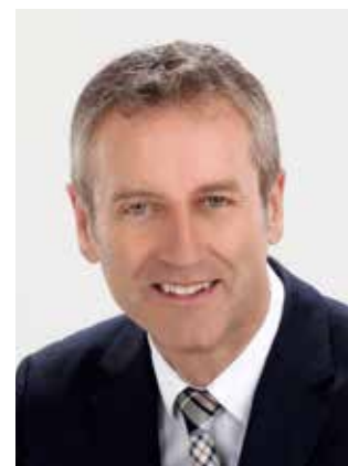
Hans Kern Erster Bürgermeister