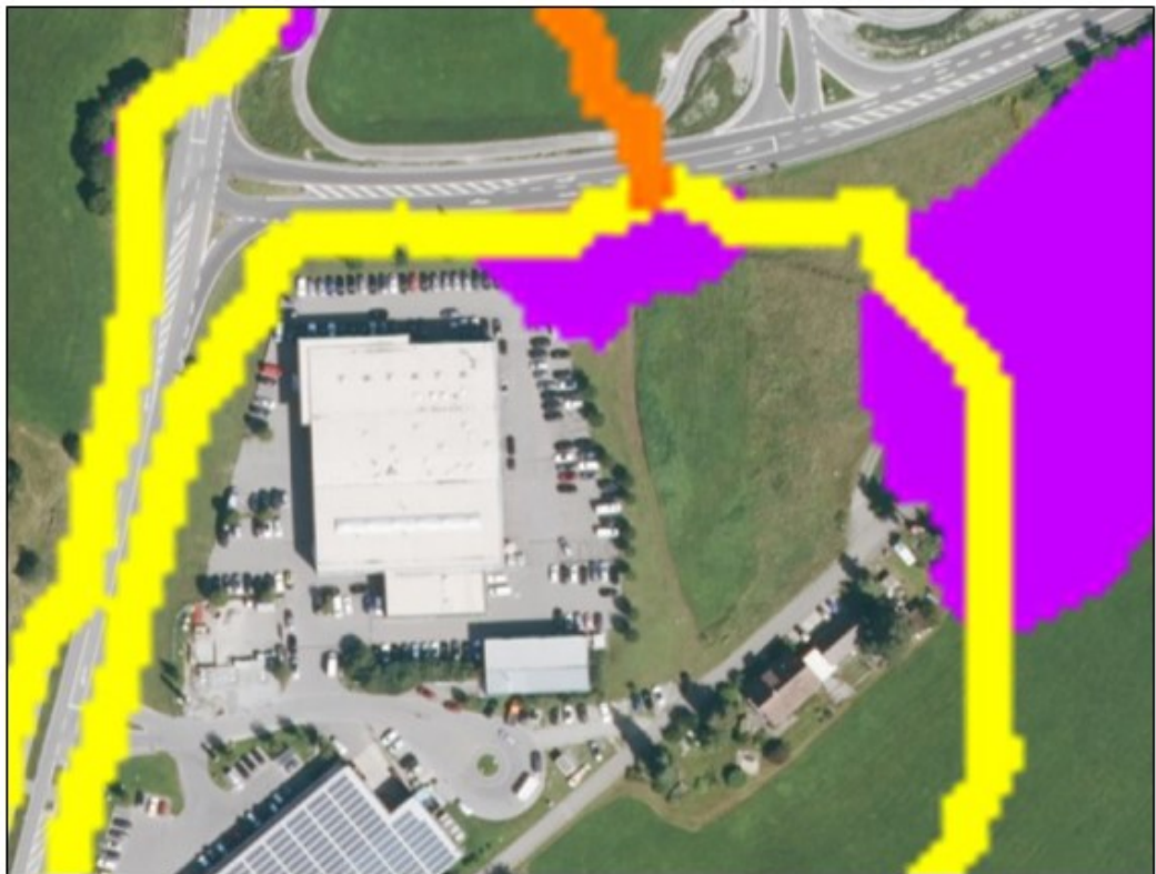
„Hinweiskarte für Oberflächenabfluss und Sturzflut“ (HiOS-Karte) mit Aufstaubereich (lila) und möglichen Fließwegen bei Starkregen (gelb).